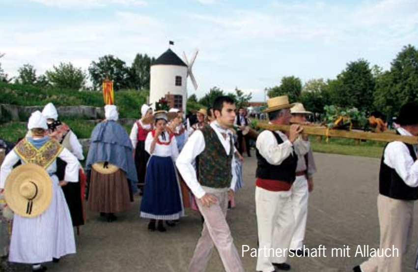
Partnerschaft mit Allauch